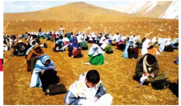
J.R.S. en Afghanistan

Depuis 2006, on enseigne également l'anglais, l'informatique, la biologie et