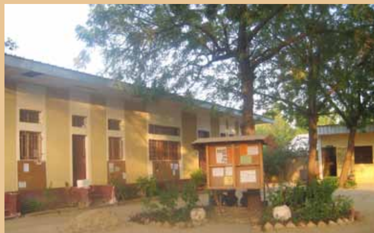
Centre Catholique Universitaire - N'Djamena (CCU)